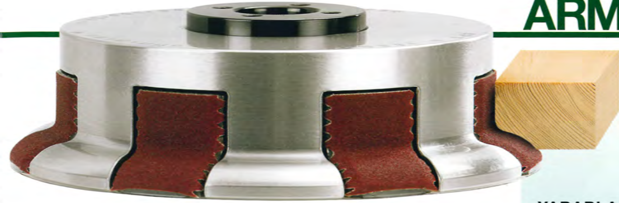
Metal Gövde ile Uni-Line

Yatay frezelerde, CNC makinalarda, kapak ve kapı üretiminde hızlı değişim, kolay kullanım ve uygun fiyatla sağlanan çeşitlilik. CNC makinalarda ve profil makinalarında, yüksek standart ve doğrulukla üretim.