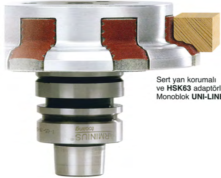
Sert yan korumalı ve HSK63 adaptörlü Monoblok UNI-LINE

Das Beste für Profile Fräsen und Schleifen / Numéro un pour les profilés Fraiser et Poncer / Il numero uno per profili Fresare e Levigare / Profil Kesme ve Zımparalama için en iyi çözümler