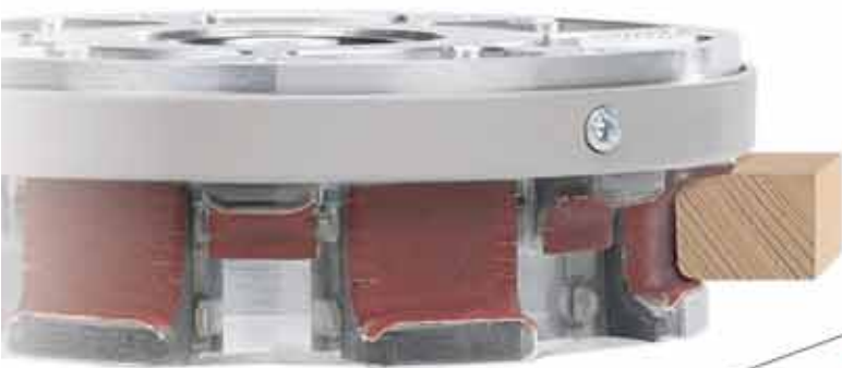
Uni-Line 7+7 Składane narzędzie z 2 tarcz szlifujących

Odwiedźcie nas Państwo w internecie pod: www.arminius.de