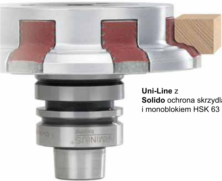
Uni-Line z Solido ochrona skrzydła i monoblokiem HSK 63

Das Beste für Profile Fräsen und Schleifen Numéro un pour les profilés Fraiser et Poncer Il numero uno per profili Fresare e Levigare The best for profiles Cutting and Sanding