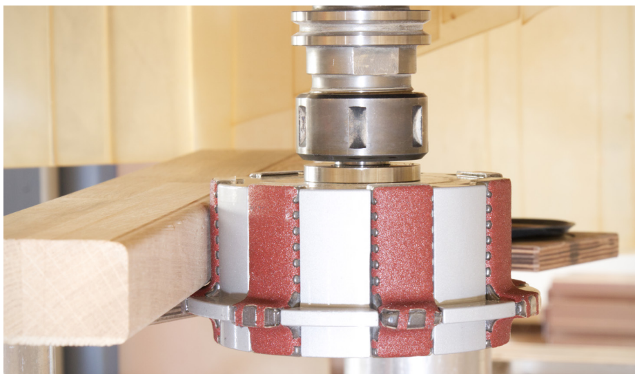
Präzise Kantenbearbeitung eines Werkstückes aus Buche.

Die robuste Werkzeugbauweise bietet dem Anwender nicht nur ein langlebiges Werkzeug über Jahrzehnte hinaus. Der